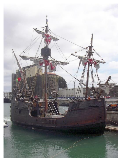
Replica v.d. Santa Maria in de haven van Funchal, Madeira