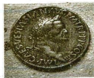
Koperstuk van Keizer Vespasianus, kop c. 3 munt.

Is het Morinengeld allerzeldzaamst, het Romeins integendeel reeds van de eerste tijden der overheersing was gemeen. Men moest weldra aan de keizer de tol en aan de grondeigenaar de pacht betalen; men bewoonde huizen, waarvan de muren bezet waren met marmeren platen of versierd met schilderwerk; de vrouwen droegen uitgedoste klederen en kostbare juwelen, op de tafel prachtig, rood geprent aardewerk en glanzende glazen bekers, zo dun als papier. In een woord men won en men verteerde geld, maar he was ook gepot. Dit getuigt de vondst rond oktober laatstleden, van zeven honderd negen en veertig koperen geldstukken wegende zestien kilogrammen en uitgedolven te Beveren (Leye), op vijf honderd meters van de grote baan Kortrijk – Gent Die stukken gaande van Keizer Trajanus (98 –