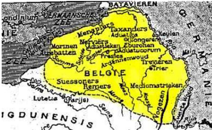
(Kaart van "België" ten tijde van het Romanum Imperium)

Morini is de naam voor een Belgische bevolkingsgroep die ten tijde van Caesar gevestigd was in de kuststrook van Noord-Frankrijk en België. Onder keizer Augustus gaven zij hun naam aan één van de civitates van Gallia Belgica. Van oorsprong is hun naam Keltisch en verwijst naar de zee, keltisch mori (vgl. Aremorici , de voor de zee wonenden).